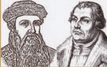
Montage: Hans Dölzer